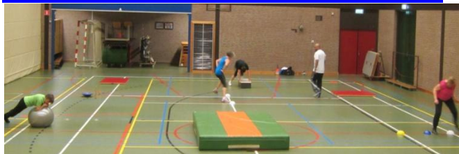
*Intensief oefenen in een circuit vergt veel van de conditie.

In de week van 23 februari hebben de scholen in de regio Midden-Nederland vakantie en liggen onze cursussen stil. Vlak daarvoor is er nog wel SneeuwFit: op woensdag 18 februari in Veenendaal en op donderdag 19 februari in Ede. Zie ook 'Agenda'. Dit zijn vervangende lessen voor alle SneeuwFit-deelnemers die niet mee gaan naar de skibaan in Huizen. Dus als u nog een extra uur intensief wilt SneeuwFitten, dan kan dat in die twee lesuren. Op 3 en 5 maart vervolgen we onze SneeuwFit-cursussen in Bennekom en Ede (beide 20.30uur!) voor de leden met een seizoenabonnement en een lopende 10-lesseenkaart. En vanaf 2 april kan iedereen in goede conditie blijven tijdens de ZomerFit-training buiten in de natuur. Meld u aan via de website, een e-mail of een telefoontje!