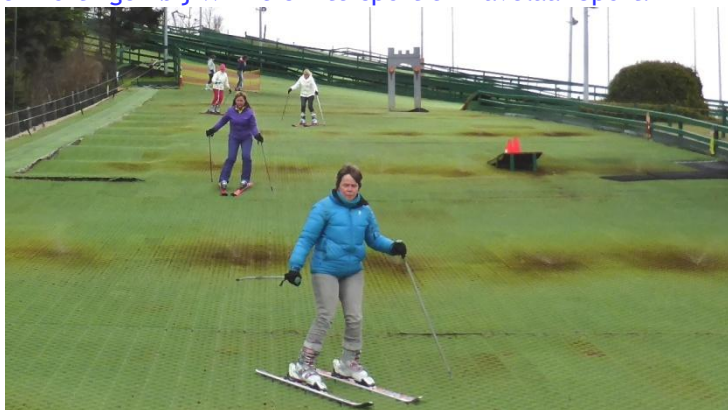
*Afdaling op de borstelbaan van Ski Compact-cursisten.

Maar voor velen van ons is het in de Krokusvakantieweek pas 'echt' als zij in de sneeuw gaan wintersporten..... Heeft u nog skikleding en -materiaal nodig, denk dan aan de acties en kortingen bij Winners Intersport en Davelaar Sport.